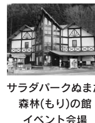
サラダパークぬまた 森林(もり)の館 イベント会場

舞伎 勢揃の場 演目 弁天娘女男白浪、稲瀬川 開演時間 午後1時45分(予定) 問い合わせ 白沢町教育支所 ☎2291へ 「サラダパークぬまた」休園のお知らせ