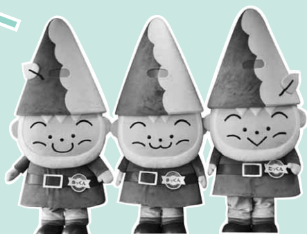
森林文化都市キャラクター「ぬまたんち」 ぬつくん・まつくん・たつくん