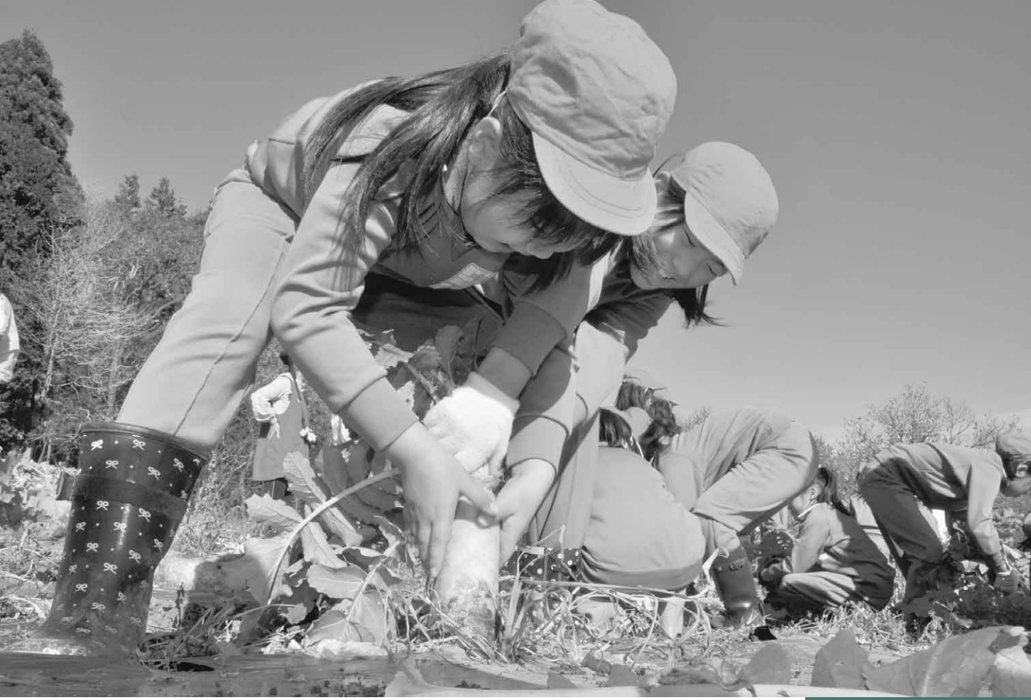
12月3日 大根収穫体験教室・沼田大好きふるさと学習(奥利根自然菜園)