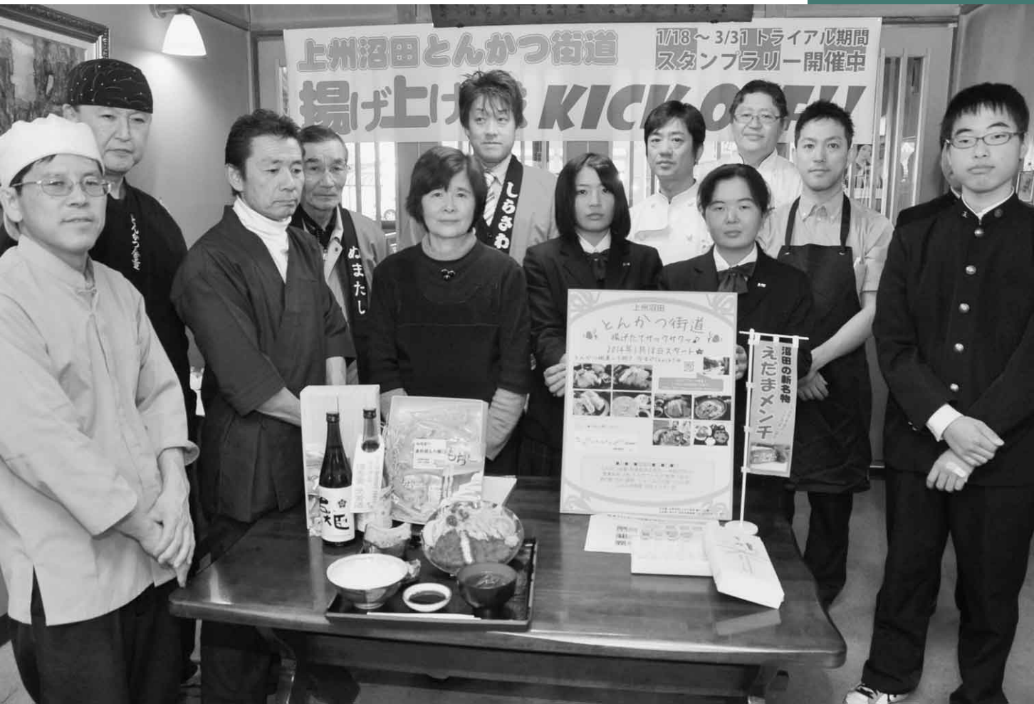
1月15日 上州沼田とんかつ街道揚げたて隊発足式(レストラン本松さかい)