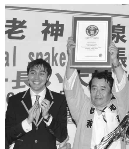
昨年のギネス世界記録™認定時の様子