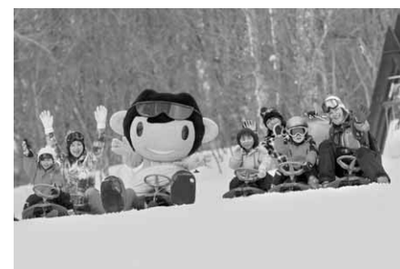
みんなで「たんばりん」に会いに来てね

今年も区長を通じて、たんばらスキーパークの市民優待券(フリート1日券割引券4枚つづり)を12月1日(月)から各世帯に配布します。ぜひ、たんばらスキーパークへお出掛けください。 問い合わせ 観光交流課観光推進係 ☎内線3246へ