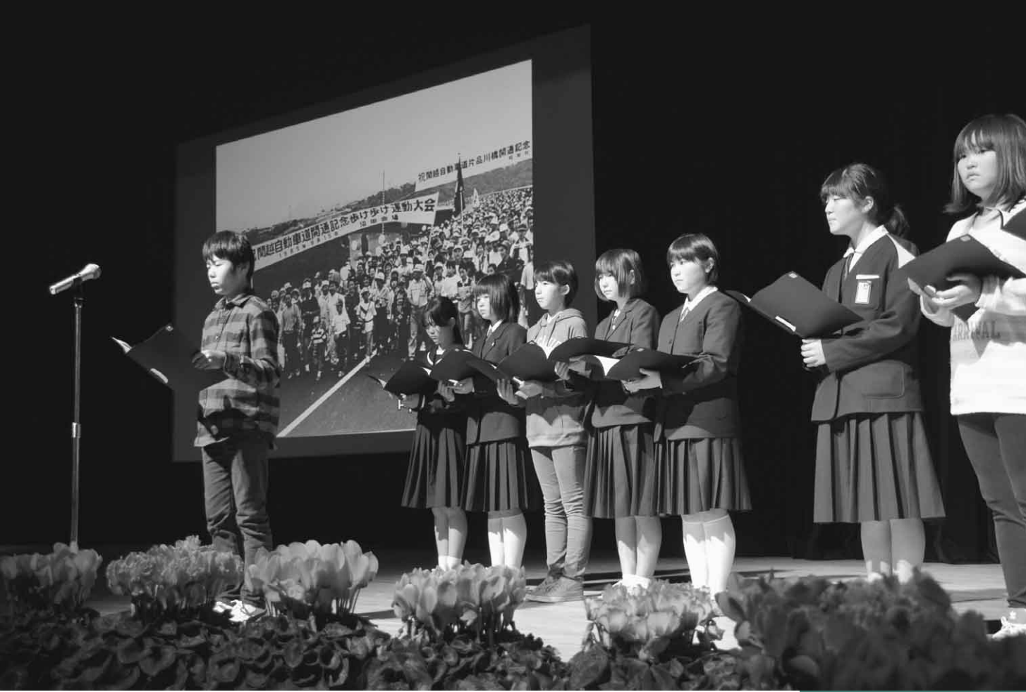
11月16日 市制施行60周年・水道布設90周年記念式典(利根沼田文化会館大ホール)