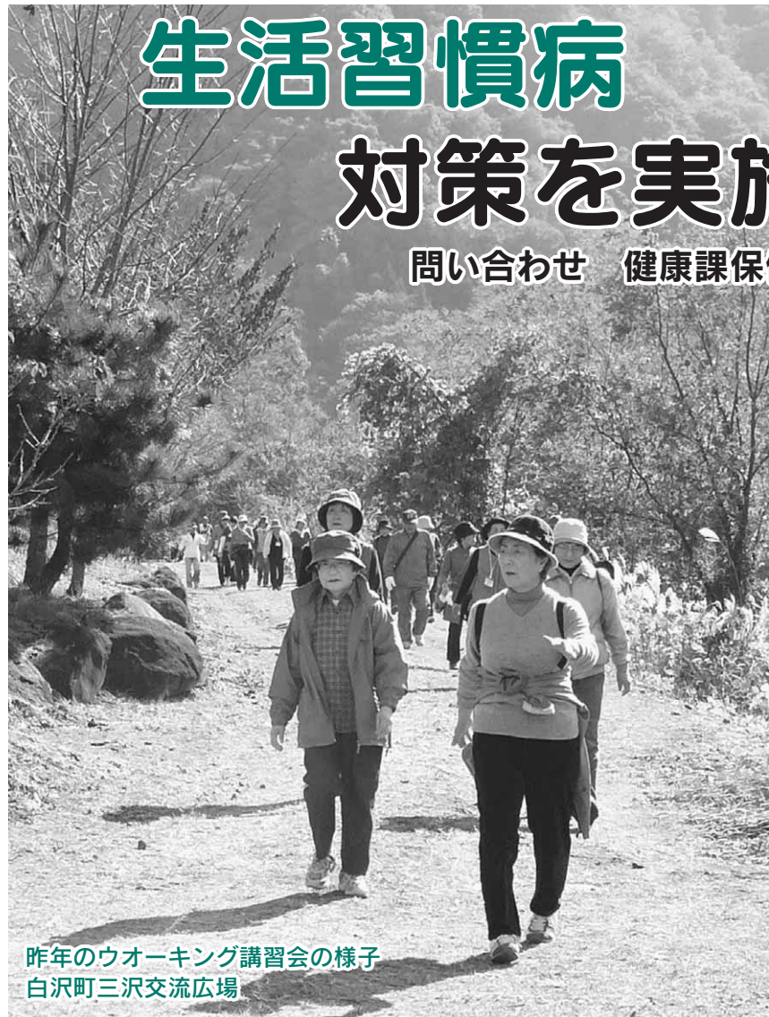
昨年のウォーキング講習会の様子 白沢町三沢交流広場

ウォーキング講習会のお知らせ 保健推進員会では、健康運動指導士を迎えてウォーキング講習会を開催します。体力に合わせた班に分かれ、片品川遊歩道を歩きます。紅葉の中、ウォーキングの基礎を学びながら、楽しく体を動かして心と体をリフレッシュしませんか。