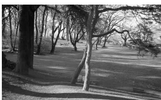
下公園(1532年、ここに「倉内城」が築かれた)

真田氏が整備する以前の沼田城は、今の「下公園」の位置にありました。中世からの領主沼田氏による1532年の築城と伝えられます。北と西の段丘崖を巧みに利用し、がけ(クワ)で囲まれた要害の地であることから「倉内城」と呼ばれたようです。崖の下に段丘礫層とその下層の沼田湖成層との間からは清水が湧き、今の榛名神社の辺りには「根岸」と呼ばれた城下集落も営まれました。