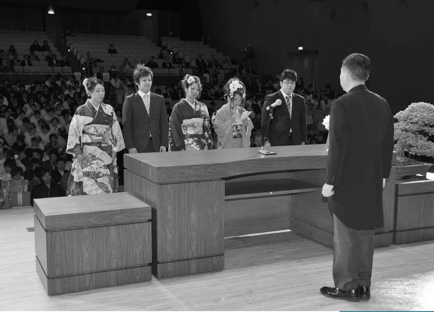
1月8日 沼田市成人式（利根沼田文化会館）