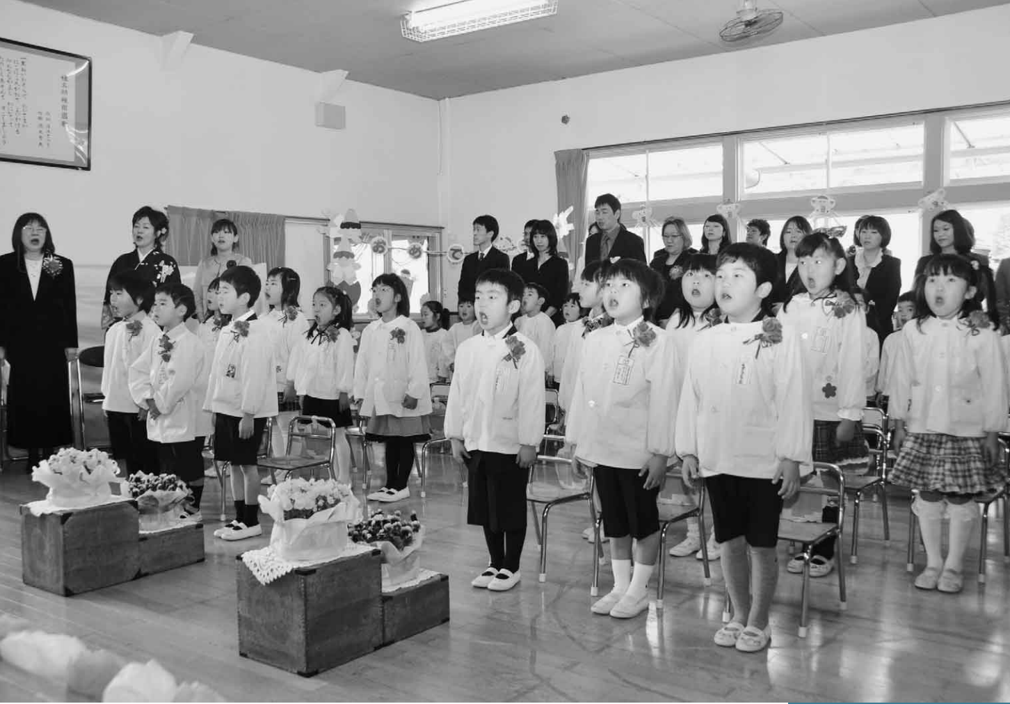
3月22日 幼稚園卒園式（榛名幼稚園）