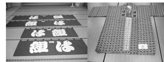
東原新町裃纏、幕、テント