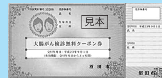
がん検診無料クーポン券の見本

特定の年齢の市民に、子宮頸がん、乳がん、大腸がんに関する検診手帳と検診費用が無料となる「がん検診無料クーポン券」を送付します。利用方法は、通知でお知らせします。