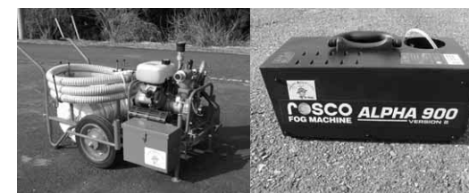
沼田市消防小型動力ポンプ、スモークマシン