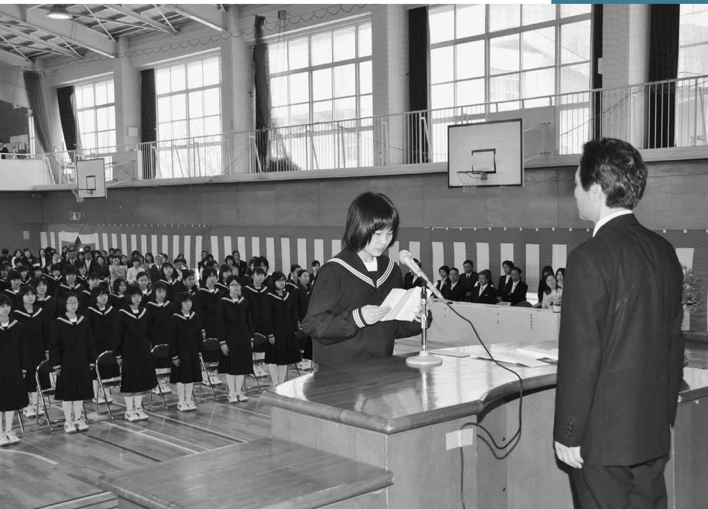
4月9日 中学校入学式 (沼田南中学校)