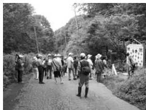
昨年度バスハイク(玉原高原)