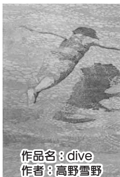
作品名: dive 作者: 高野雪野

■東京芸術大学卒業修了作品展 卒業修了作品で150号クラスの大作を中心に展示します。