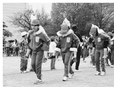
北っ子タイム(異学年交流)

ぼくの通っている沼田北小学校の自慢を2つ紹介します。一つ目はマーチングです。引き継ぎ式するとき、先輩から受け継いで「指揮者を中心に「カーガード」「金管」「メロディオン」に分かれます。ぼくが担当している指揮者は、運動会るときにスピニングや投げ技をします。3人で工夫しながら頑張っている練習しています。カラーガードは、きれいな旗で8人が協力し合って演技をします。金管パートは、いろいろな金管楽器できれいな音を出します。メロディオンの人は、主な旋律をはつきりとした音で演奏します。運動会では、みんなの心を一つ