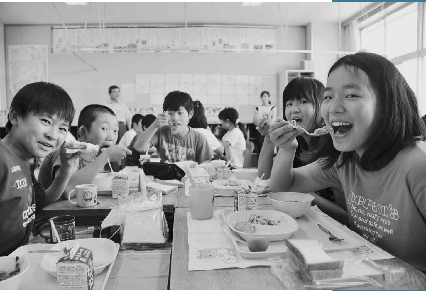
7月17日 「えだまメンチ」学校給食登場（白沢小学校）