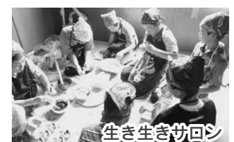
生き生きサロンの遊びで一緒に汗をかくたり、白玉

団子を作って食べたりの間にお年寄りや気持ちがいいになります。私たちが子どもの元気が大人に力を与えるんだと私自身実感することができました。こうした経験をこれからの学習に役立てていきたいです。 最後にあいさつです。授業で返事や発表の仕方を身に付けて言葉で伝えるようにしています。目と耳と心で聴くことを心掛けています。人と人との関わりを大切にいろいろな交流を通して今よりもっといい升形小学校にしていきたいです。