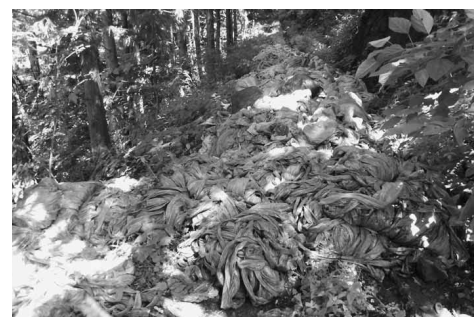
山間部で発見された大量の農業用マルチ

ごみの不法投棄は、法律で固く禁じられていて、不法投棄をした場合は厳しく罰せられます。市内の不法投棄は、人通りの少ない道路や山間部などに多く