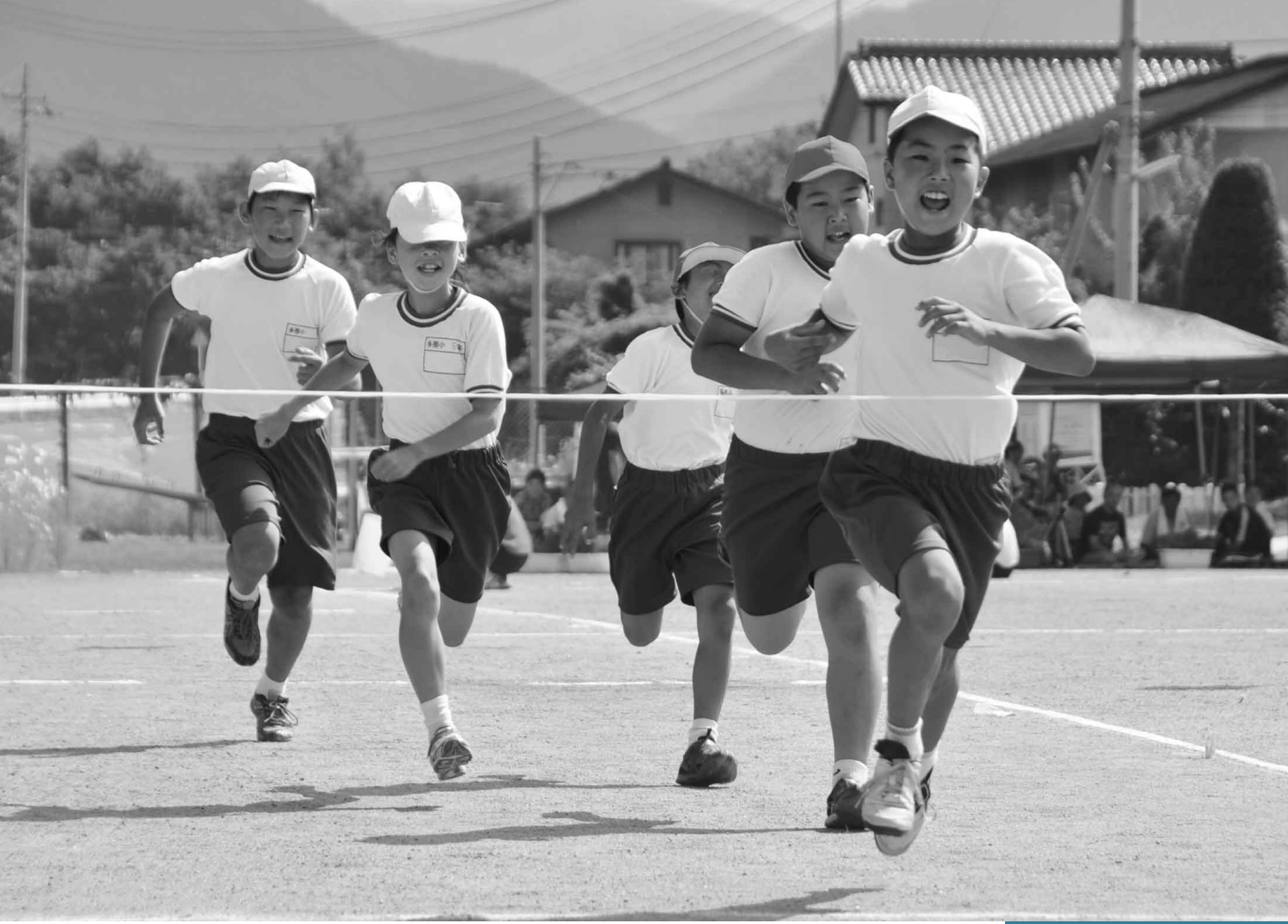
9月8日 多那小中学校秋季大運動会 (利根町多那)