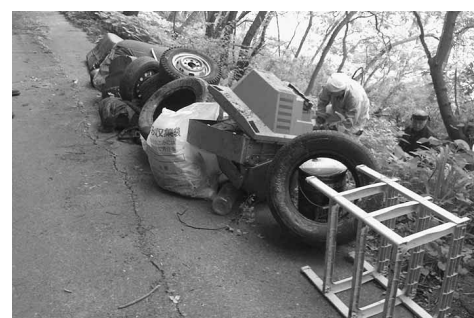
道路沿いで発見された廃タイヤ・テレビなど

見られ、家電や廃タイヤ、産業廃棄物など多種多様化し、量も大量であるなど悪質化しています。不法投棄は地域の美観を損なうだけでなく、環境汚染を引き起こします。