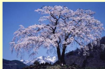
上発知のシダレザクラ

関東三大天狗の御山と知られる迦葉山には、日本一と言われる大天狗面が安置されています。このお寺では、お参りしたときに天狗面を借りて帰り、次にお参りするときに門前の店で新しい面を買い求めて借りた面とともに寺に納め、また別の面を借りていくという風習があります。