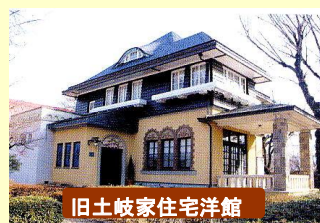
旧土岐家住宅洋館

沼田公園は市民や観光客の憩いの場として親しまれています。公園内には江戸時代の代表的な町家づくりが当時のまま残る国指定重要文化財「旧生方家住宅」や沼田藩最後の藩主土岐氏ゆかりの登録有形文化財「旧土岐家住宅洋館」があります。ぜひ、ご覧になってください。