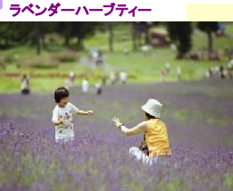
ラベンダーハーブティー

ラベンダーソフト ほのかに香るラベンダーと牛乳のこくがマッチ。おいしさ一番人気です。