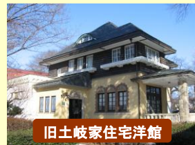
旧土岐家住宅洋館