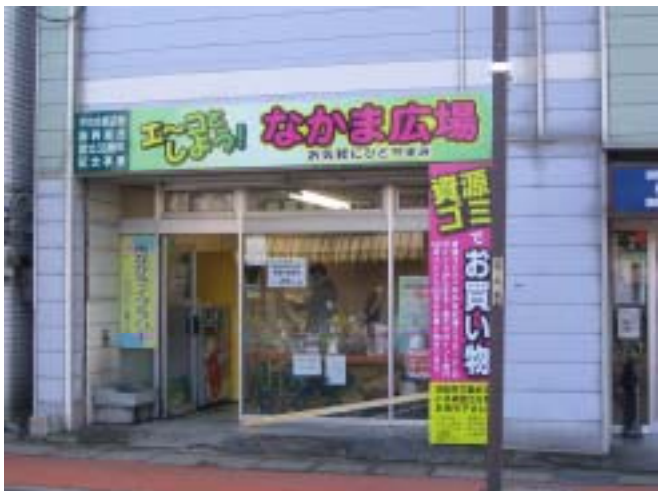
されました。みなさんお気軽にお立ち寄り下さい。

* 「内臓脂肪を撃退！メタボリックGOGO」の看板は本町通り南側に設置してありますので併せて本町通りを回遊し、健康になりましょう。