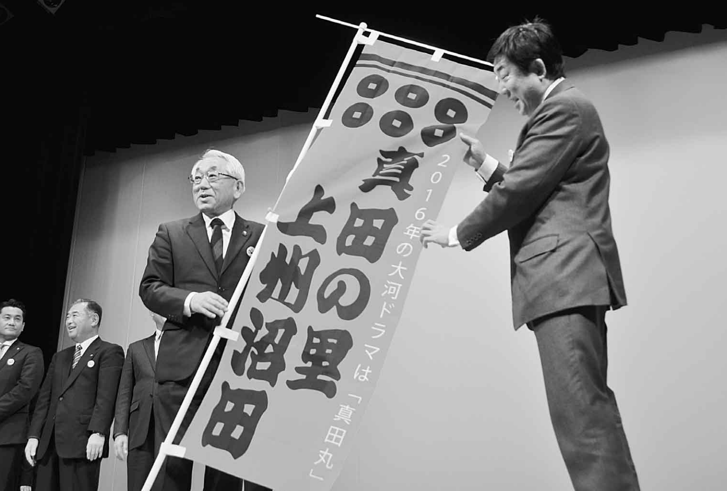
12月13日(日) NHK大河ドラマ引継式(前橋テルサ)