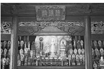
四国八十八カ所を模した諸像正面の額には「瑠璃殿」の文字

ぬまた 歴史 探訪 121 秩父の観音札所の巡礼や四国の八十八カ所霊場の遍路など、心の旅に若い人も加わるようになり、静かなブームが続いている。 江戸時代中期頃、札所や霊場を巡る信仰は今以上に盛んで、聖地を模した場所への巡礼の旅が行われた。迦葉山弥勒寺を一番とする「沼田板東札所」はその一例で、今でも残される。 南郷に古色豊かな薬師堂が建つが、本尊の薬師如来像の周りに、眼を見張る四国八十八カ所を模した諸像が荘厳に安置されている。少し痛みの見られる像もあるが、黄金色に光る一体一体は尊うしく、一堂に会せると、威光に圧倒される。 黒く塗られた台座の部分に国名、霊場に番号、寺名が丁寧に朱書きされ、花飾りの舟形の光