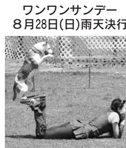
主催 ドグタウン工房