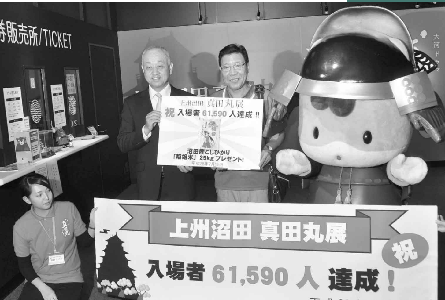
7月15日(金) 真田丸展入場者数が61,590人に到達(上州沼田真田丸展)