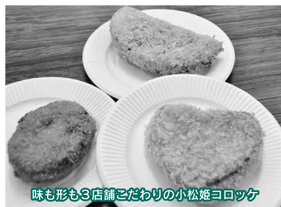
味も形も3店舗こだわりの小松姫コロッケ