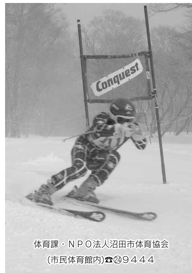
体育課・NPO法人沼田市体育協会 (市民体育館内)☎249444

とき 2月7日(日)午前8時30分開会(8時受け付け開始) ところ たんばらスキーパーク 対象 市内に在住・在勤・在学する人 種目 ▼小学生低学年・高学年の部(男子・女子)▼中学生の部(男子・女子)▼男子10歳代、20歳代、30歳代、40歳代、50歳代、60歳代、70歳以上の各部▼女子10歳代、20歳代、30歳以上の各部 申し込み 1月22日(金)までに市民体育館、または白沢町・利根町教育支所へ(小中学生は承諾書を添えて直接。高校生以上は電話申し込み可) ※当日の受け付けは、一切いたしません