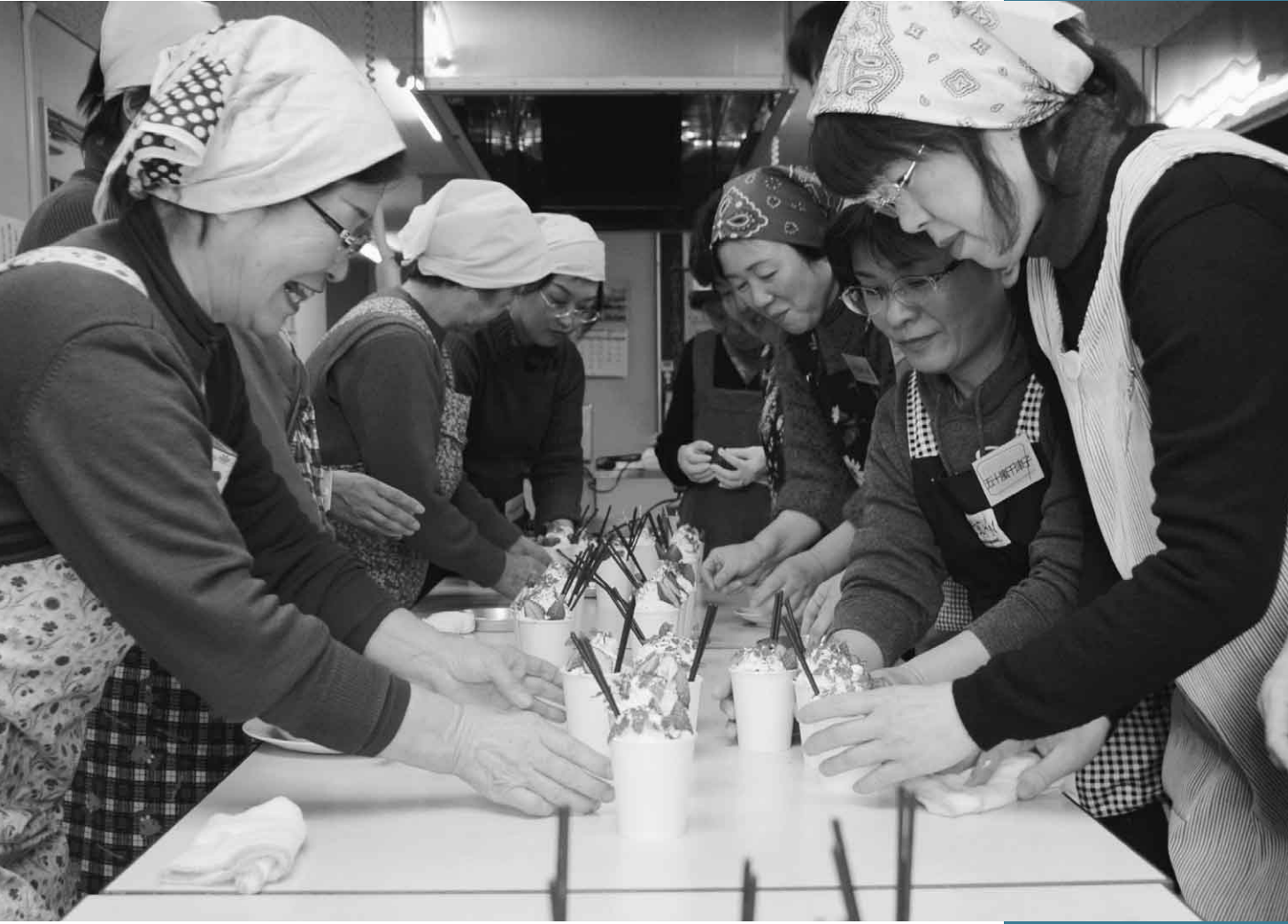
手作りクリスマス

クリスマスを前に、中央公民館の洋菓子教室でクリスマスケーキ作りが行われました。カップに生地を入れて生クリームやイチゴなどを飾り付け、クリスマスツリーに見立てた雰囲気あふれるかわいらしいケーキです。心が温くなる手作りお菓子が出来上がりました。