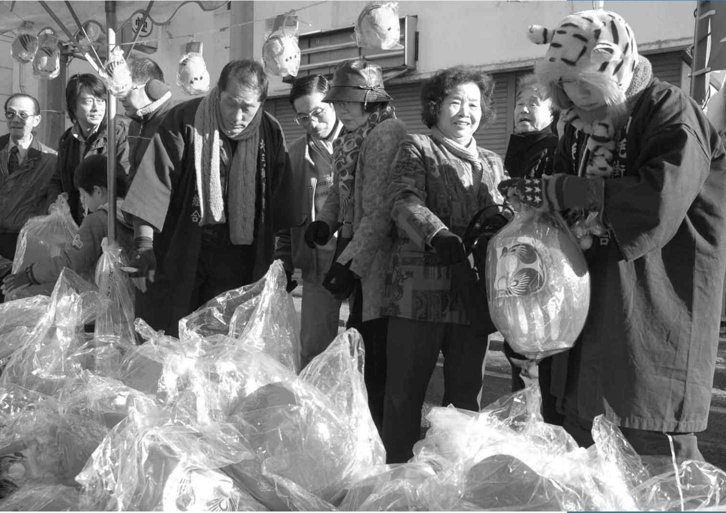
1月16日 沼田だるま市(本町通り)