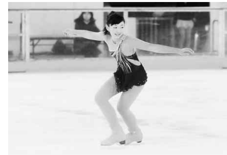
昨年12月、県中学校総体で(前橋市)

間も滑ることもありませう。けれど、難しい技ができるようになったときはとてもうれしいです。現在、沼田中学校の二年生。学校が好きで友達も多い。部活は、ソフトテニス部に所属し好きな教科は体育。とにかく、体を動かすことが得意だ。「部活を始めてから筋力や体力が付いて、体も引き締まってきました。おかげで前よりも故障が少なくなりました。今は、部活もフィギュアも楽しいので両方とも頑張つて続けたいですね。目標は、国体に出場すること。まずは、Aクラスで滑るために六級に合格したいです。それには、練習を積んでもっといい演技ができるようにならないと貴重なこの経験を生かし、今後もさらなる高みを目指す。」