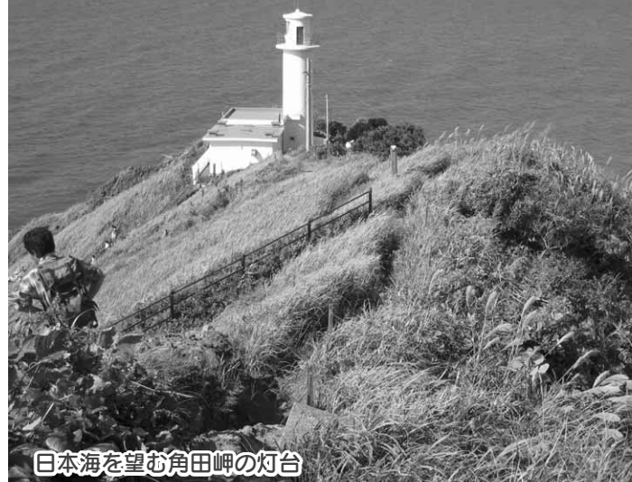
日本海を望む角田岬の灯台

食べることは、生きる力につながります。調理の基礎をマスターして、毎日の食事を楽しく健康的なものにしませんか。 とき 6月25日/7月16日/8月6日・27日/9月17日の金曜日(全5回)午後6時15分~8時15分 ところ 保健福祉センター3階調理実習室 対象 40歳以下で、全日程参加できる人 定員 25人 ※定員になり次第締め切り 費用 無料 内容 食事の話・調理実習 申し込み 健康課保健係 詳しいことは、同係 ☎ 内線76205へ。