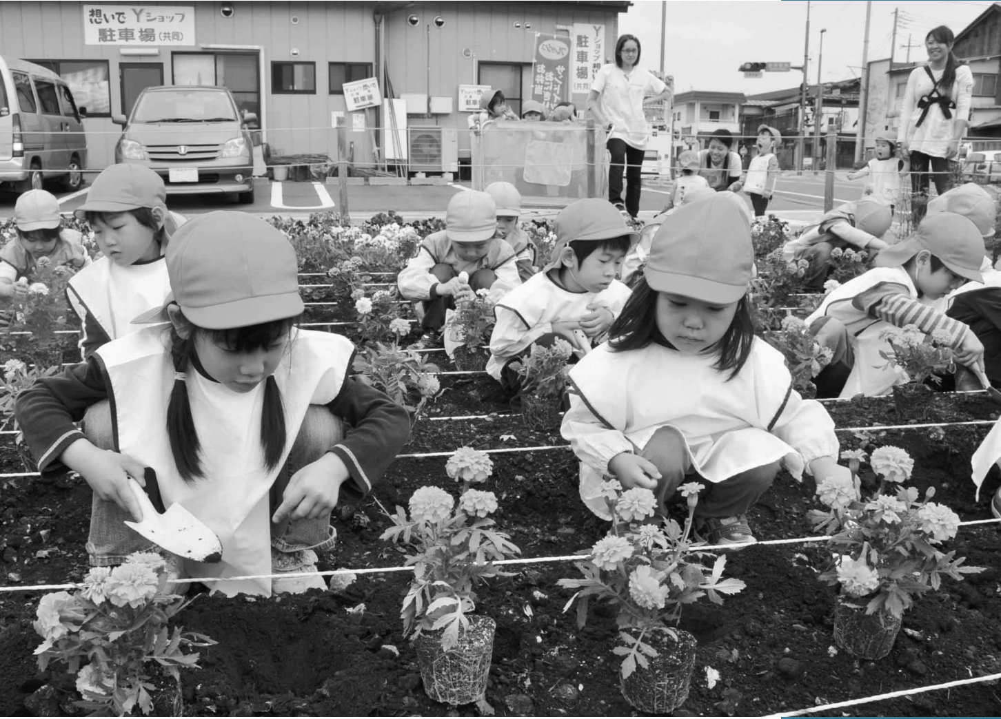
5月19日 公園緑地ふれあいイベント (沼田駅前フラワー広場)