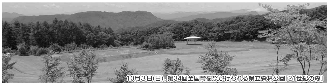
10月3日(日)、第34回全国育樹祭が行われる県立森林公園「21世紀の森」