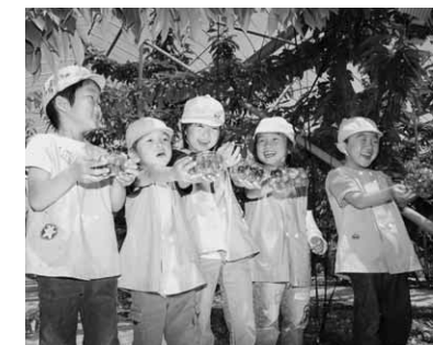
昨年の合同開園式の様子

き、みんながよいものを作ろうと努力しています。こちらにも常に勉強していきなさいとお客さんがまた来てくれないですからね」 シーズン中は、県内はもとより東京都や埼玉県などからも多くの観光客が訪れる。 「毎年、県内外から大勢の人が来てくれます。サクランボ狩りは、お客さんの反応がすぐに返ってくるんです。おもしろかった、また来ますと笑顔で言われるとうれしくて。それが一番の楽しみですね」 沼田のフルーツは、サクランボを皮切りに、ブルーベリーやサマーフルーツ、ブドウ、リンゴへと続く。 「サクランボは、沼田のフルーツのトップバッターですから。みんなで盛り上げていきたいですね。ぜひ遊びに来てください」