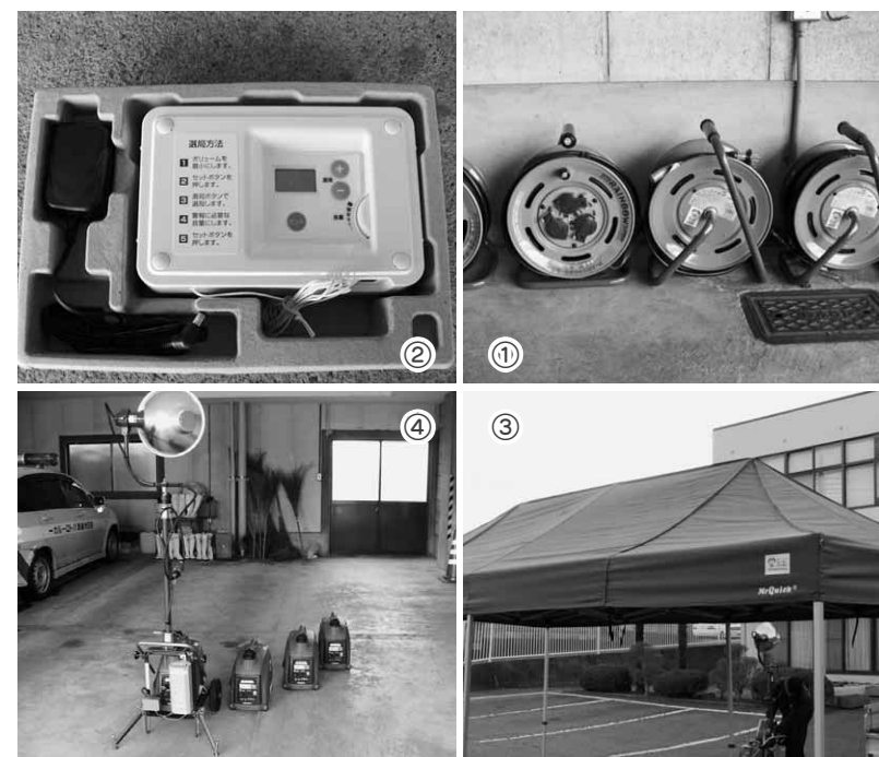
①コードリール②緊急告知ラジオ③ワンタッチテント④投光器付き発電機

（財）自治総合センターでは、宝くじの収益によるコミュニティ助成事業を行っています。この事業では、宝くじの普及広報を行うことやコミュニティの健全な発展を図ることを目的に、助成活動を行っています。昨年度のコミュニティ助成事業は、総務省消防庁より指定を受け、「地域防災スクールモデル事業」を実施しました。これは、消防団員などを指導