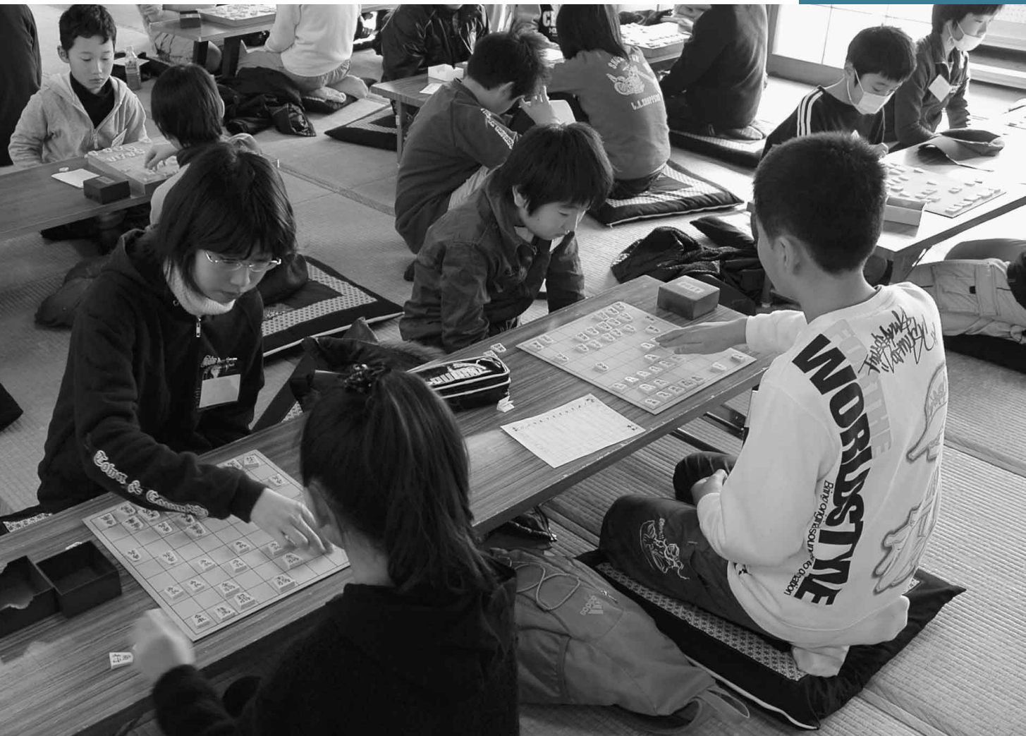
2月15日 第8回利根沼田小中学生将棋名人戦(鍛冶町公民館)