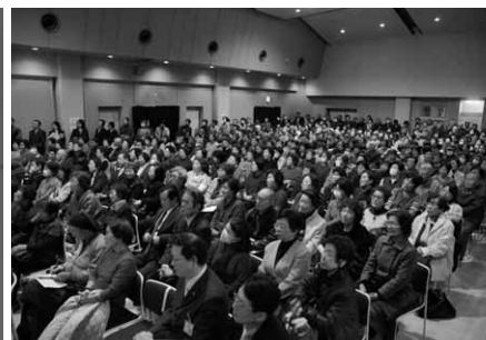
多くの聴衆が訪れた講演会