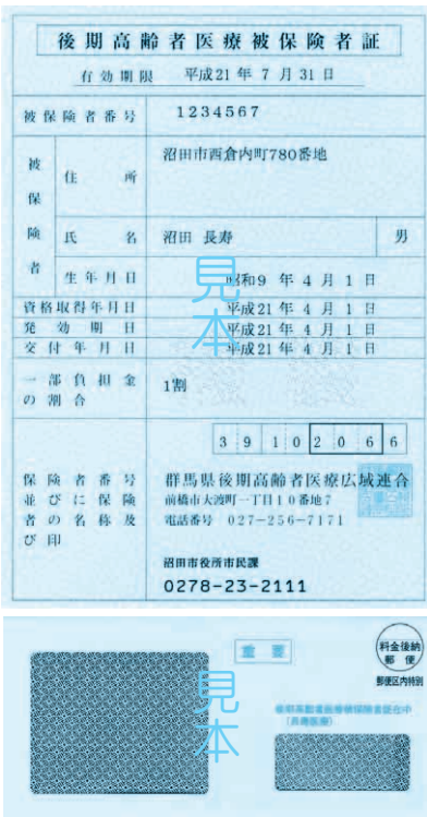
保険証表面(上)と封筒(下)見本

※②の手続きを一度された人は再度、手続きをする必要はありません。口座振替で滞納した場合、年金からの天引きに戻ることがあります