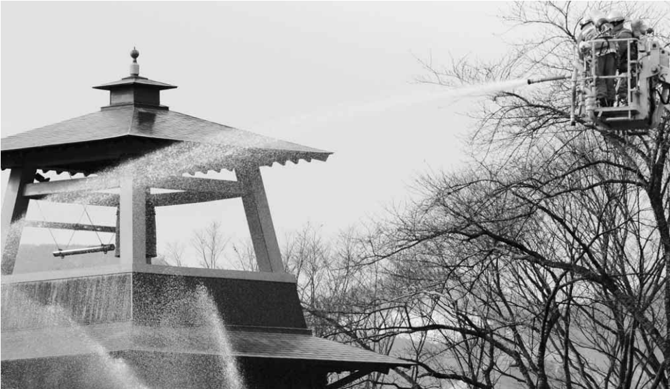
鐘樓の火災を想定した消火訓練(文化財防火デー)

これからの季節は空気が乾燥し火災が発生しやすい時季です。本市では、昨年(平成18年)中の火災発生件数合計33件のうち、3月から5月の発生件数は13件と一年で一番火災の多い時期となりました。火気の取り扱いには、十分注意しましょう。