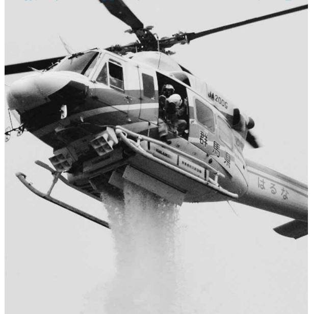
林野火災を想定した消火訓練(市地域防災訓練)

春季全国火災予防運動と同一の期間に、「全国山火事予防運動」が実施されます。全国的な林野火災の出火原因は、たき火、たばこ、放火(放火の疑いを含む)、火入れの四つが、全体の約七割を占めています。春は乾燥・強風などで湿度の低い気象状況が続く、山火事が発生する危険性の高い季節です。森林は、地球温暖化の主な原因である二酸化炭素を吸収・貯蔵し、保水機能により水害を防ぐ貴重な資源です。一度焼失すると、回復には長い年月と多くの労力を要することとなります。