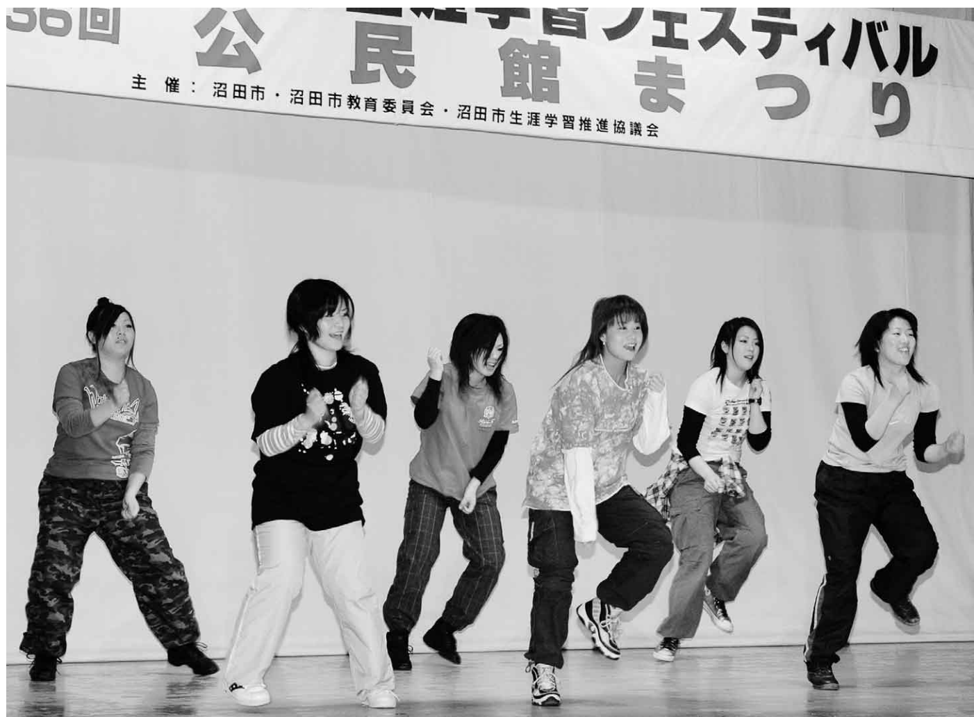
2月2日～4日 生涯学習フェスティバル・公民館まつり(中央公民館)