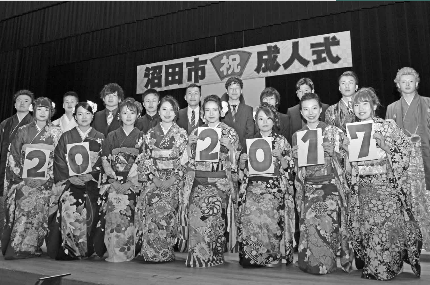
1月8日(日) 沼田市成人式実行委員(利根沼田文化会館大ホール)