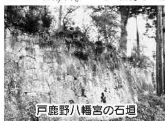
戸鹿野八幡宮の石垣

石垣は城郭の象徴の一つである。沼田で正保の絵図を証しに、沼田城の石垣の発掘調査が精力的に行われているが、石垣はそれ程に建物や史跡にとつて重要な役割を担っている。布積、野面積、亀甲積など石の形状や積み方により石垣は種類が分けられ、時代とともに細かい加工が施されている。城の石垣に勝るとも劣らない聖域を守る石垣が、戸鹿野町の八幡宮と沼須町の砥石神社に見事な風姿を留めている。双方とも、積み石の隅を丁寧に加工して、接合部の隙間がほとんど見られない。天部は奇麗に揃えられ、石垣面は平坦で直線的に加工され、安定感や堅固さが保たれ、石垣の美しさが際立ち、細工した石工の広い見識や高い技術が感じられる。