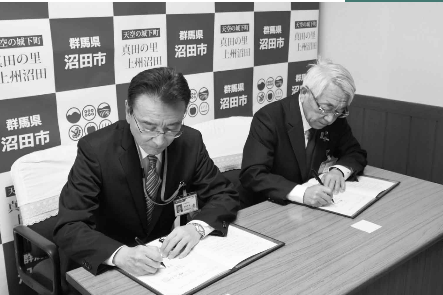
3月30日(木) 沼田市・郵便局 「包括連携に関する協定」および「災害発生時に関する協定」締結式(沼田市役所)