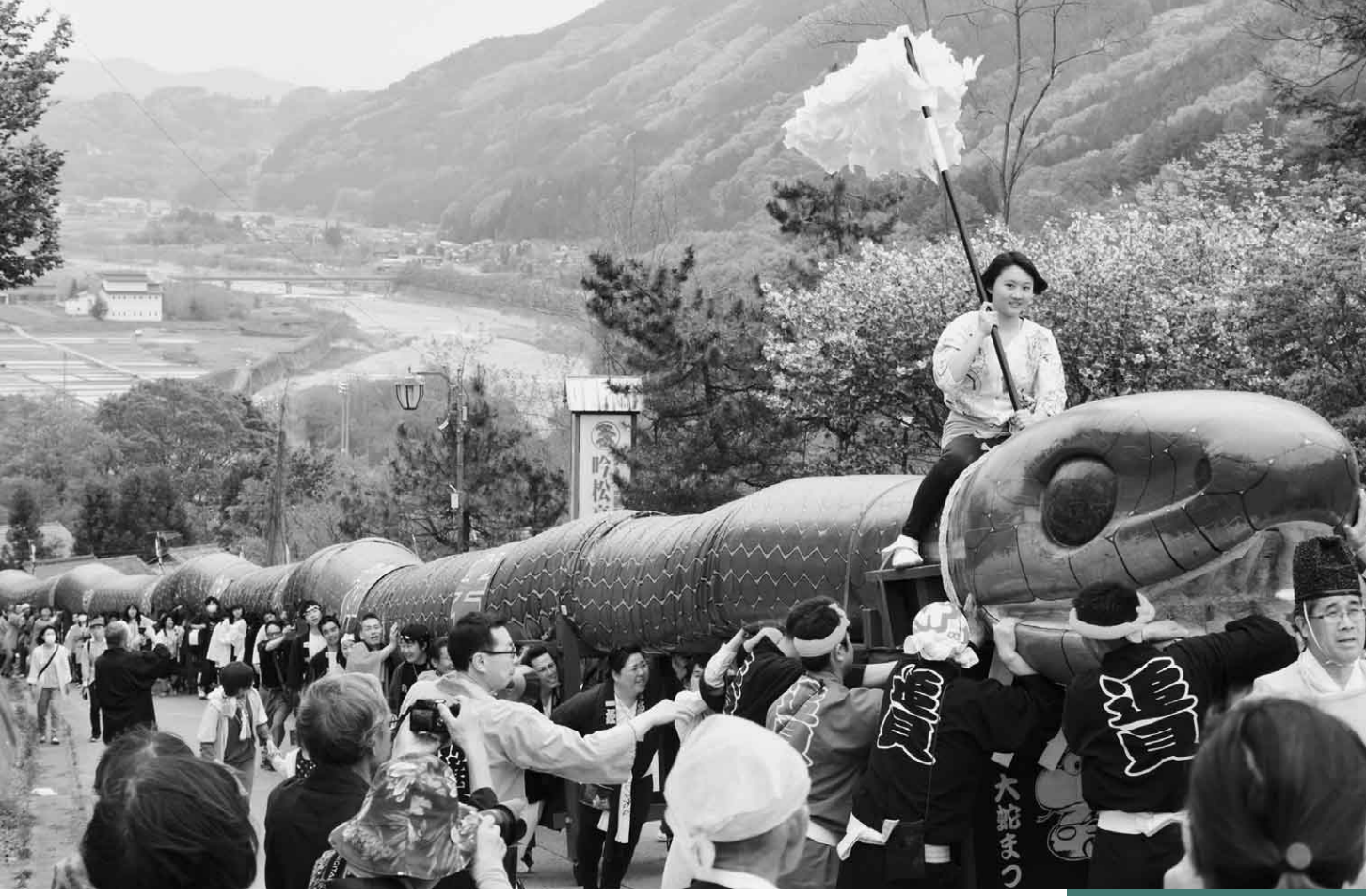
5月12日(金) 老神温泉大蛇まつり大蛇みこし渡御(老神温泉)