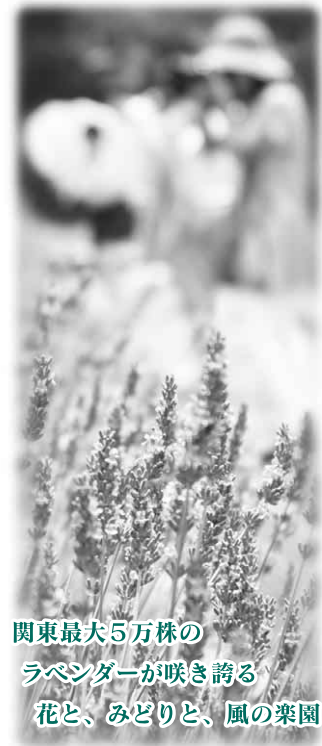
関東最大5万株のラベンダーが咲き誇る花と、みどりど、風の楽園

たんばらラベンダーパークが6月24日(土)にオープンし、7月中旬から関東最大5万株のラベンダーが見頃を迎えます。また、オープン期間中の一定期間、市内では沼田駅から、たんばらラベンダーパーク間の一般乗り合いバスを運行します。