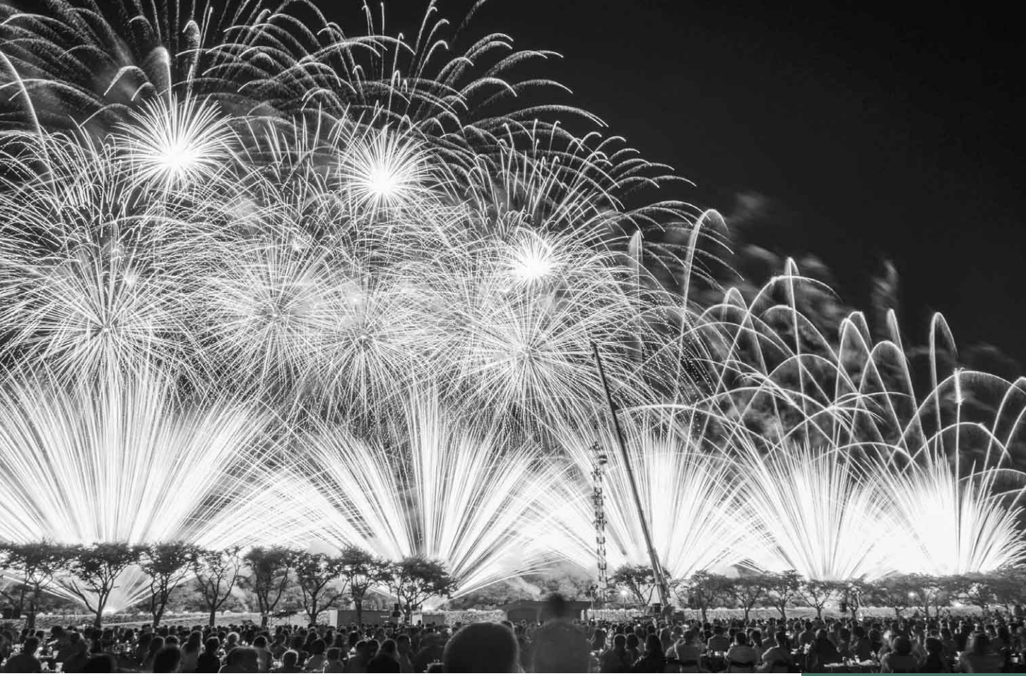
9月9日(土) 第5回沼田花火大会(沼田市運動公園)