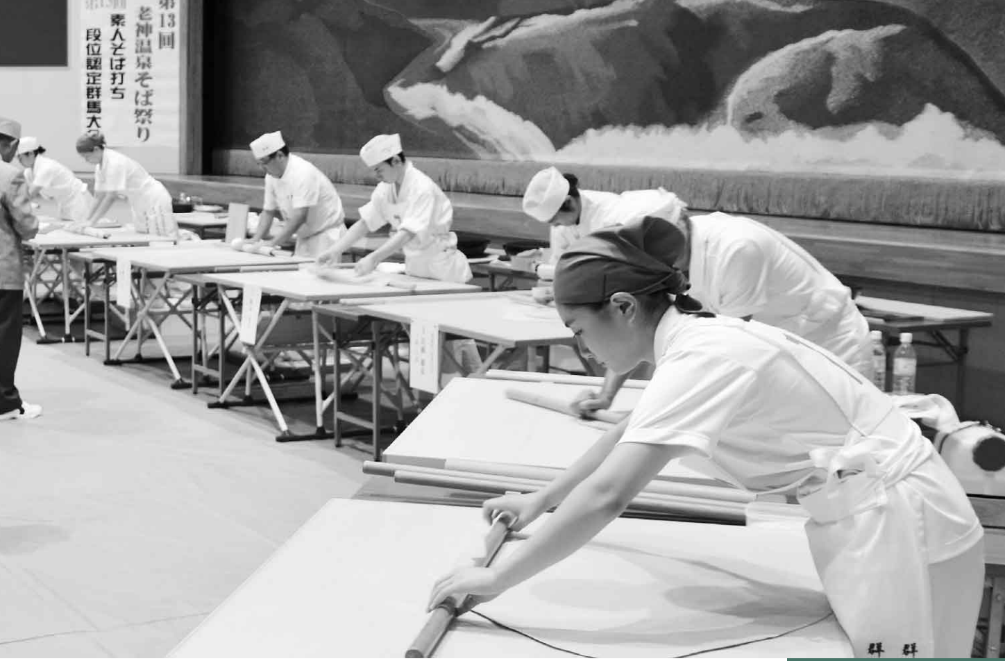
9月23日(土)・24日(日) 第13回老神温泉そば祭り(利根観光会館)