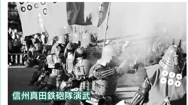
信州真田鉄砲隊演武

昨年引き続き、上州沼田真まつりを開催します。ぜひ、お出掛けください。 イベント詳細 ◇11日(土) 食のイベントブラス、姫の茶会、こどもチャンバラと忍者手裏剣、ステージ演舞、音楽ステージイベント、歴史対談など ◇12日(日) 食のイベントブラス、城主の嫁取り、甲冑隊による武者行列、信州真田鉄砲隊演武など 問い合わせ 観光交流課観光推進係 ☎内線3246へ