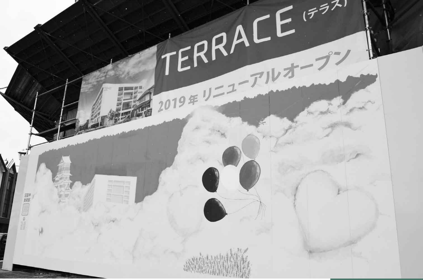
11月2日(木) パネルアート作品を展示(テラス沼田)