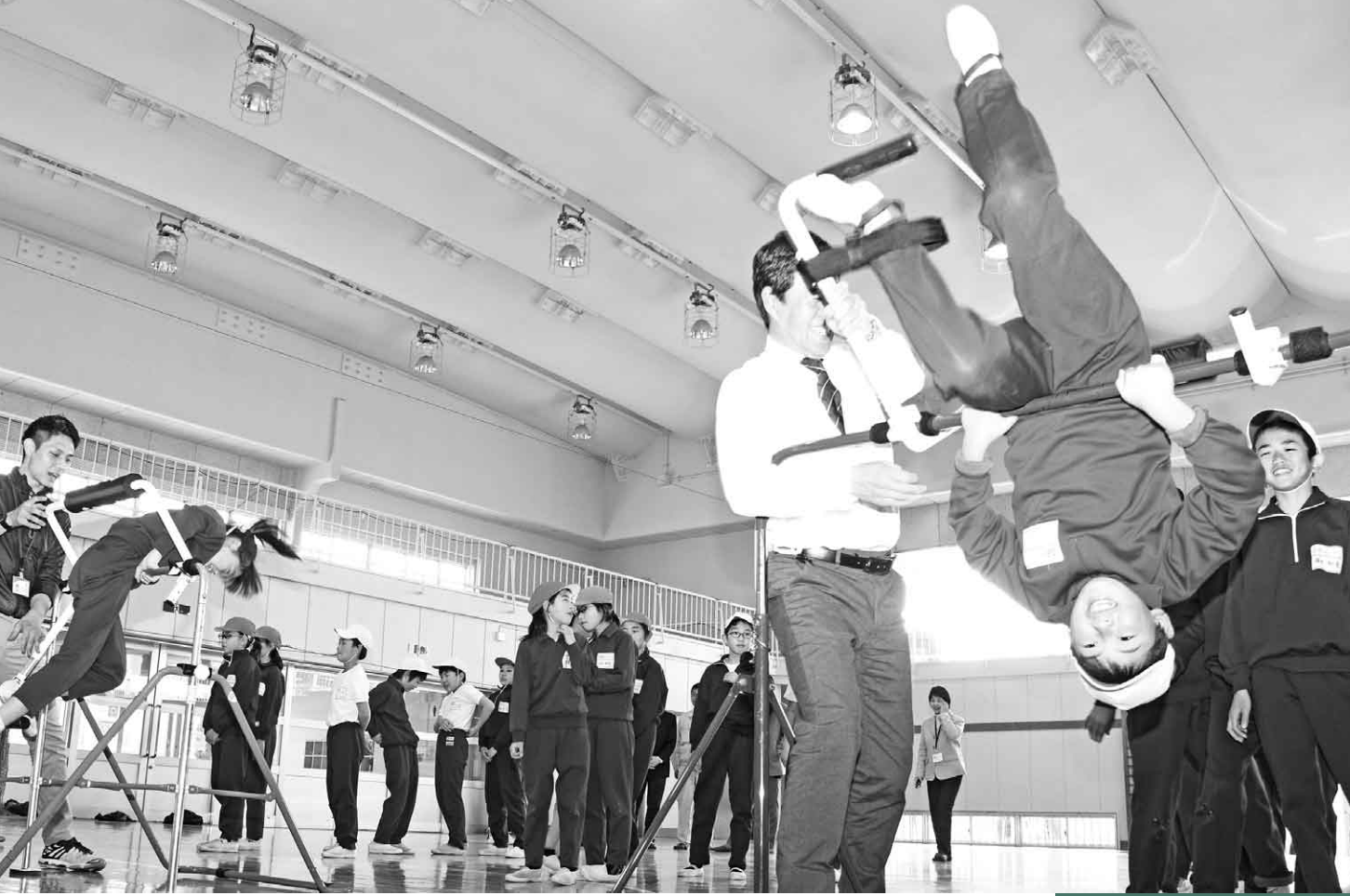
3月13日(火) ミズノグループから奇贈された練習器で逆上がりに挑戦(沼田小学校屋内運動場)