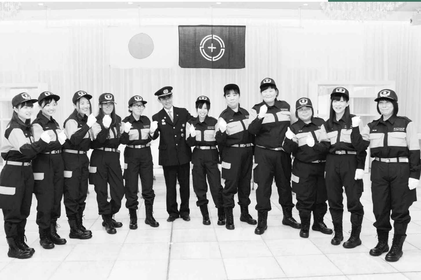
4月2日(月) 女性消防隊「SOLEIL(ソレイユ)」(ホテルペラヴィータ)