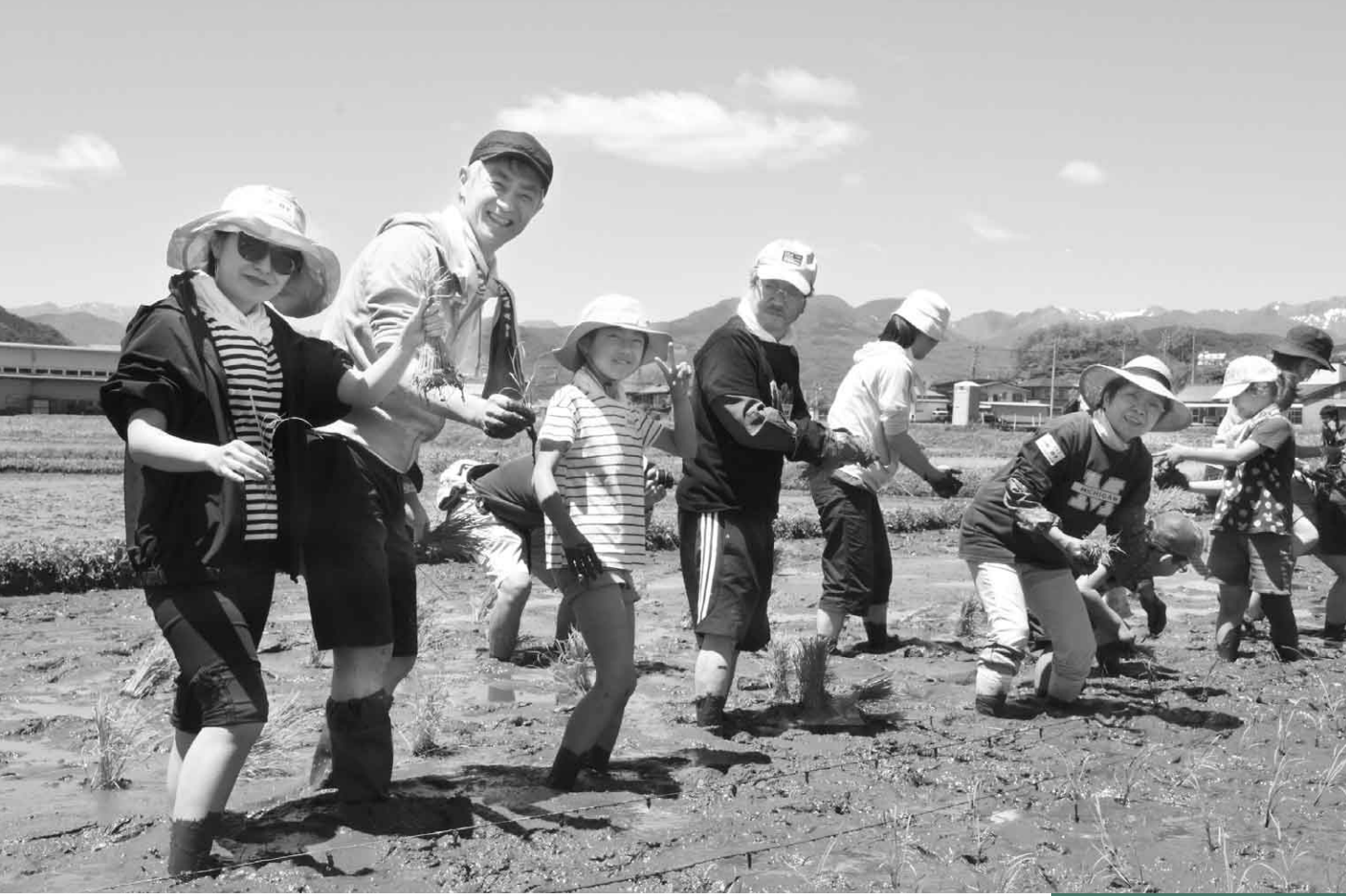
5月20日(日) 田舎体験ツアー 田んぼ編(白岩町)