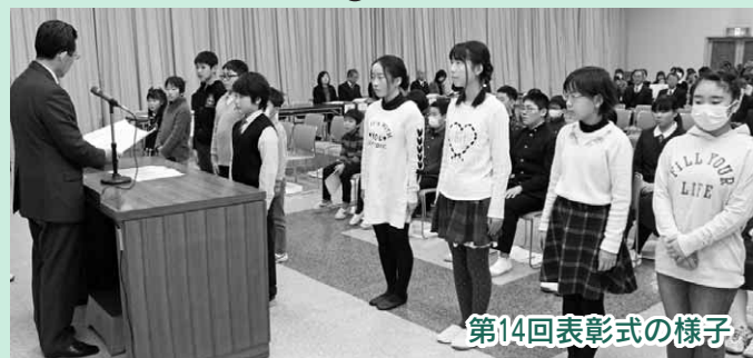
第14回表彰式の様子