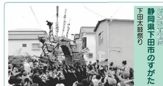
姉妹市下田 静岡県下田市のすがた 下田太鼓祭り

下田旧町内が最も盛り上がる2日間 今年も下田の市街地を熱くする下田太鼓祭りが行われま す。みこしや供奉道具、太鼓台などが街へ繰り出して一日 中練り歩き、小みこしを勢い新たに押し上げる太鼓橋では、 勇壮な男衆の勢いに観客の熱気も最高潮を迎えます。 また初日の夜には、太鼓台が1列に並んでのそらい打ち が行われ、各町はこごそとばかり競い合うように、花火と 提灯に照らされながら、笛や三味線、太鼓を打ち鳴らし、 下田の夜の街に音色と熱を届けます。 とき 8月14日(火)～15日(水) ところ 下田市街地 問い合わせ 下田市観光協会 ☎0558②1531へ