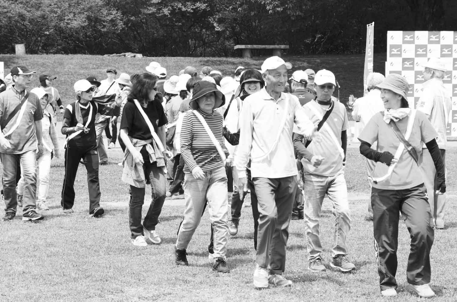
5月26日(土) ウォーキング大会(沼田公園グラウンドほか)