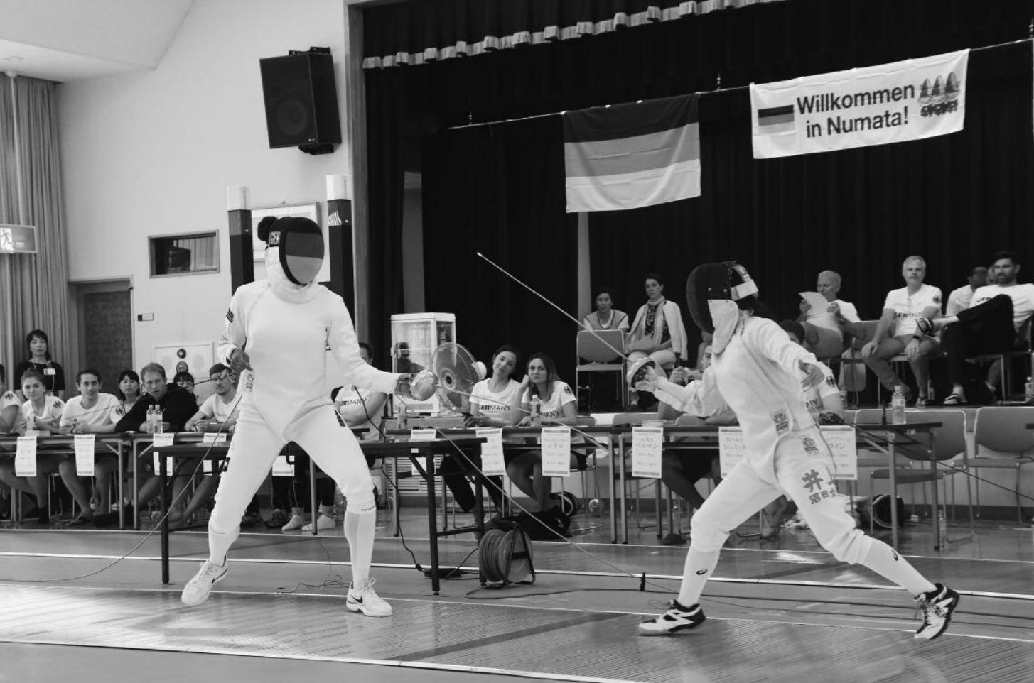
7月14日(土) ドイツフェンシングチームとの交流会(白沢支所)