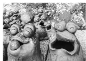
展示作品目標2000作品

▽陶芸教室での作品を一緒に展示のこみに展示します とき 8月18日(土)午前10時〜