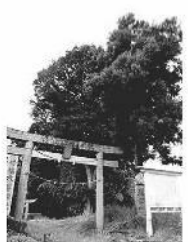
武尊神社では杉の木に結う(下沼田町)

ぬまた 歴史 探訪 146 沼田市文化財調査委員 金井 竹徳 昨年の秋に発行された、薄根地区の魅力伝える「薄根地区かるた」の「ほ」の読み札は「武尊様、梵天結わえ、風祭で、あまのついで、立春から数えて210日、雑節の一つ「二百十日」ころに行われる、風祭除けの農家の大事な行事である。大切な稲の開花期は、台風の多いころに当たるため、厄日として警戒、中稲の結実が無事に済むように各所でさまざまな風祭が行われる。 「二百十日」について面白い話がある。徳川時代、幕府の暦の天文方洪川春海(天文暦学者)は大の釣り好き。ある秋、快晴の空を見て、品川の海に舟を乗り出そうとした。それを見た老漁夫が、遠くの水平線に浮かぶ雲を見て「今日は二百十日、大風が吹くから」と注意したところ、案の定、午後から大荒れとなった。春海は老漁夫の見解を重視し、新たに創られた「真享暦(1684年)に二百十日を採用した」という。 薄根地区では、8月