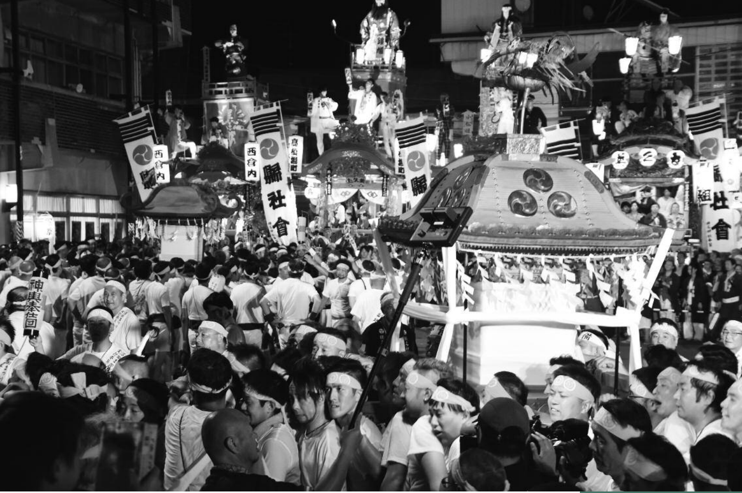
8月5日(日) 須賀・榛名神社みこしと祭りばやし共演(市役所広場)