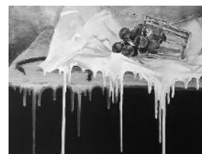
9月28日(金)~30日(日) 南雲麻衣作品展 同時開催 アトリエはなみずき教室 代表 南雲麻衣