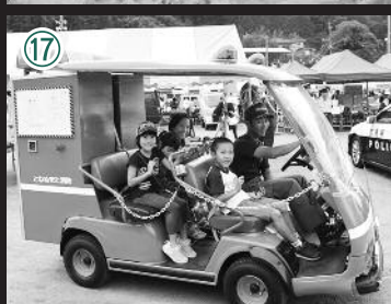
写真①町内7地区みこし競演②子どもみこし③カニレフア④上古語父地区まんど⑤二荒太鼓⑥天狗みこし渡御⑦子どもみこし行列⑧各町まんど共演⑨オープニングセレモニー⑩千人おどり⑪沼田祇園囃子競演会表彰式⑫町みこし共演⑬雅蓮によるみこし渡御⑭あかぎ団ライブショー⑮老神温泉子ども白蛇みこし⑯マスのつかみどり⑰ミニ消防車乗車体験⑱老神温泉納涼花火大会