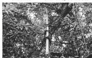
菅原神社では百枚梵天をつけた竹を梅の木に結わえている(梶田町)

薄根地区では、30日から9月1日にかけて、風祭がそれぞれの鎮守の森で行われている。共通するのは神事の後、用意された白杖梵天を、(東南)の方角にある杉や桜、梅などの大木の高い所に結わえ付け、風の鎮まりを願う方法である。東南の風は最も強く、特に警戒するという。 梶田町では、竹に20枚ずつの梵天を5段にして結び百枚梵天として、天神様の横にある梅の木に結わえる。そして「祓いたまえ、清めたまえ、とう神恵みたま」の呪文を1万回唱える(参拝者の人数で割るので百人で百回)。「とう神」とは「当地の神、四方八方の10神」であり「恵みたま」とは「恵みたまえ」の意で、呪文は唱えやすいよう「え」を抜いている。 薄根地区では、下沼田町武尊神社・石黒町大神宮、戸神町虚空蔵堂などに百枚梵天が見られる。台風の季節、風祭の大きな威力に懸けた。