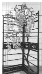
10月19日(金)～21日(日) 花工房ふきのとう作品展 押し花絵・パンフラワー 代表 戸部みち子