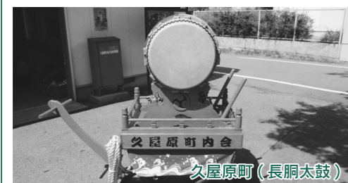
久屋原町(長胴太鼓)

今年度は、久屋原町が長胴太鼓、白岩町と堀廻町がエアコンをそれぞれ購入し、今後のコミュニティ活動に活用され、その推進が図られます。