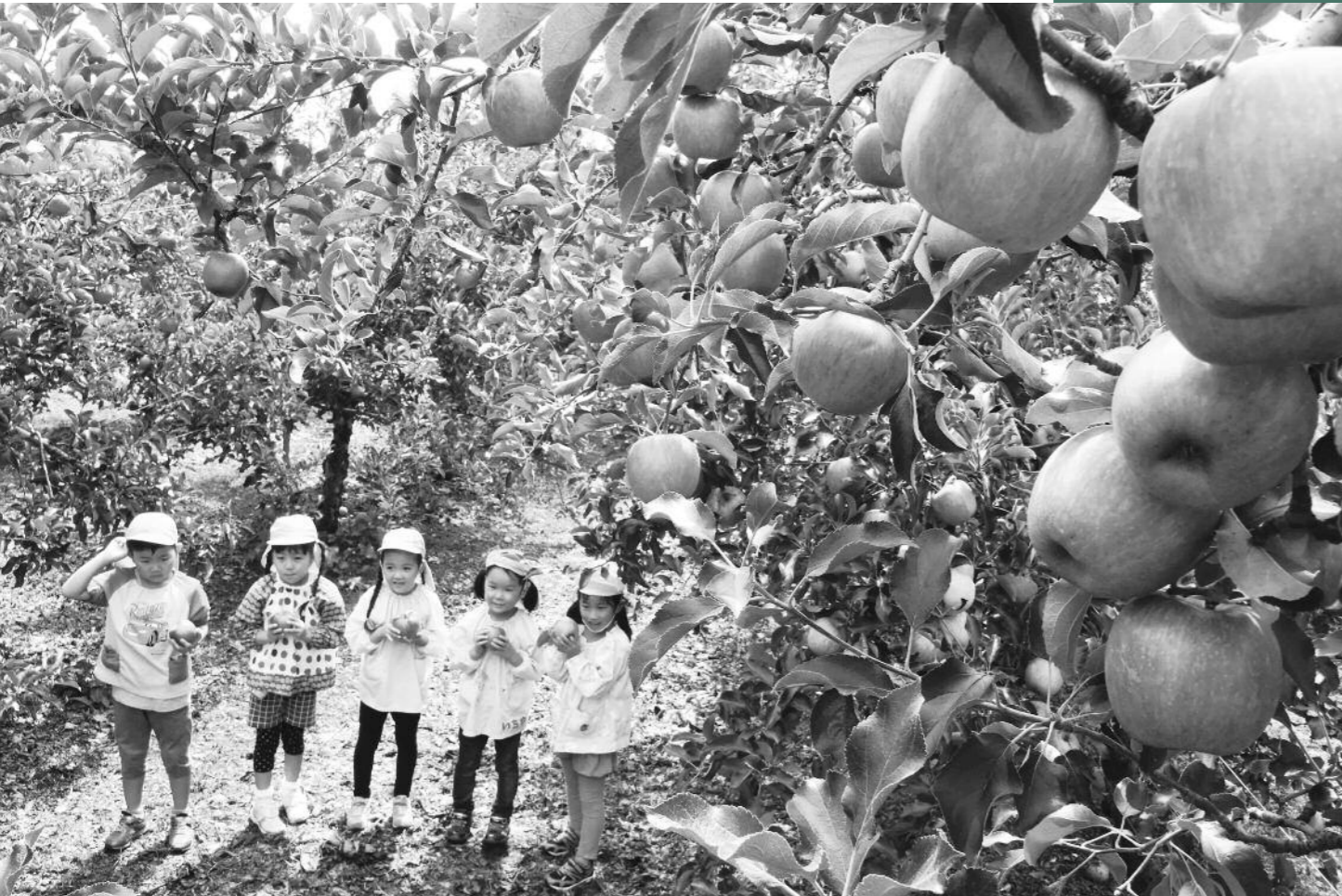
9月6日(木) 沼田市りんご組合開園式(下発知町)