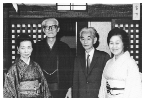
生方家を訪問した川端夫妻(右)と生方夫妻

今回は、たつゑが尊敬し、お互いに行き来もしたことがある川端康成、歌人の先人として尊敬し、たつゑ執筆の歌書の中で数多くの短歌を引用している斎藤茂吉、そして自身の歌集の口絵を描いてもらっていた、洋画・