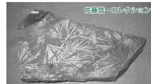
佐藤信一コレクション