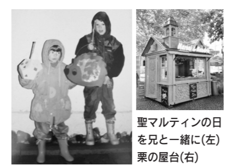
聖マルティンの日を兄と一緒に(左)栗の屋台(右)

インの火という大きなたき火まで練り歩きます。そこで聖マルティンの再現劇があり、助け合う隣人愛や慈善を表現するため、例のマントが半分に切られます。その後は皆で歌い、お菓子を食べて家族や友達と楽しめます。今でも歌を聴くと懐かしくて良い思い出が溢れ、つい歌いたくなります。