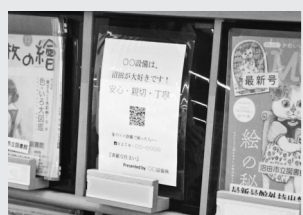
雑誌架にスポンサーの情報を掲示

雑誌スポンサーを募集します 市民参加の図書館づくりと地元業者の情報発信の場の提供として、雑誌スポンサー制度を始めました。 これは、図書館が選定する雑誌について、スポンサーを募集し、寄贈していただく制度です。 寄贈された雑誌には、スポンサー名の表示や、B5版までの大きさの範囲で情報発信を行うことができます。 対象 次の①②③のいずれかにあてはまる人 ①市内に本店または支店を置く事業者 ②匿名での協力を希望する個人 ③特に館長が認める法人・団体 申し込み 希望する場合は、図書館にご連絡ください ※随時受け付けます 問い合わせ 図書館 ☎20550へ