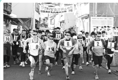
姉妹都市通信 静岡県下田市のすがた「北方領土の日」記念 史跡巡りマラソン大会

沼田ユネスコ協会では、うっかり書きそんじしてしまった郵便はがき、古くて使えないなどの理由で家庭に眠っている未使用の郵便はがき、未使用切手、テレホンカードを回収し、お金に換え募金する運動を実施しています。 この運動は、戦争や貧困などさまざまな理由で学校に行けない子どもたちや教育の機会に恵まれなかった大人たちのために、