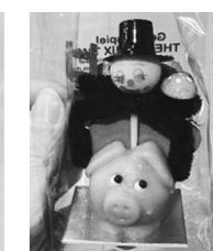
マジパン菓子(左) 煙突掃除人の飾り(右)