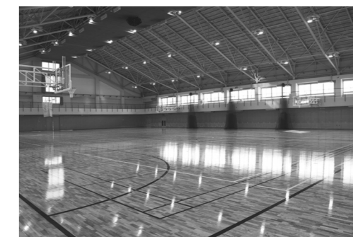
問い合わせ スポーツ振興課スポーツ振興係 (中央公民館内) ☎ 249444