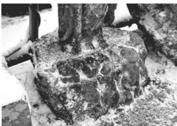
小石を積んでいる2人の幼子

顔のない像ではあるが、奥利根に唯一見る西院の地藏、幼子を守る力強い足と太い杖に迫真が現れる、貴重な像である。