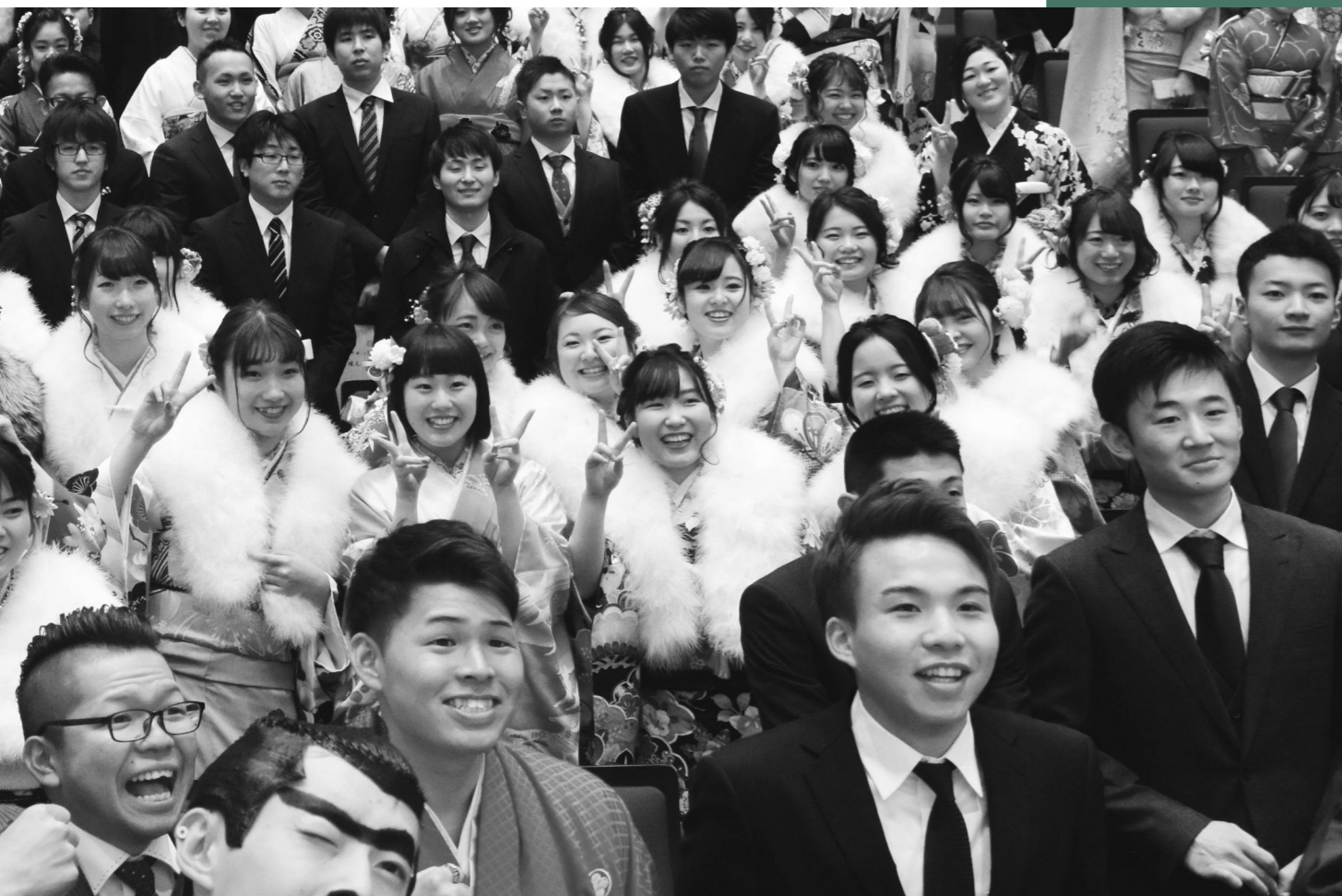
1月13日(日) 沼田市成人式(利根沼田文化会館)