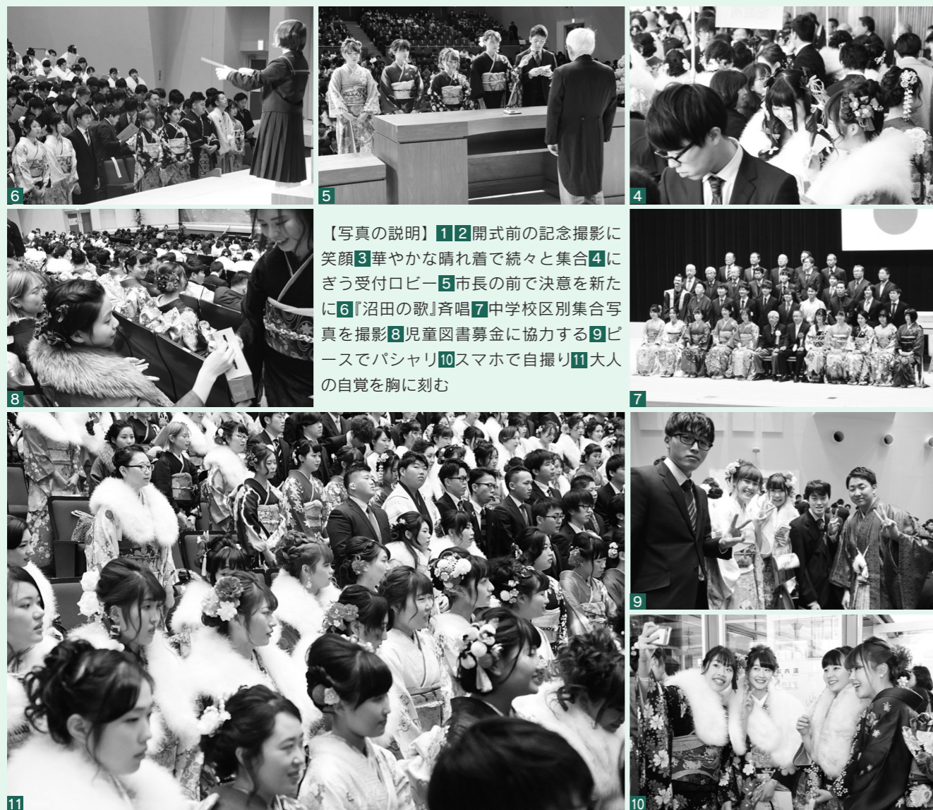
【写真の説明】1 2 開式前の記念撮影に笑顔3 華やかな晴れ着で続々と集合4 にぎう受付ロビー5 市長の前で決意を新たに6 「沼田の歌」斉唱7 中学校区別集合写真を撮影8 児童図書募金に協力する9 ビースでパシャリ10 スマホで自撮り11 大人の自覚を胸に刻む