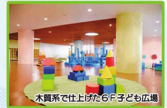
木質系で仕上げた6F子ども広場