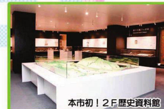
本市初! 2F歴史資料館