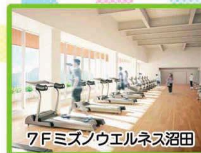
7Fミズノウエルネス沼田