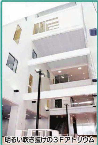
明るい吹き抜けの3Fアトリウム

市内に分散していた庁舎が1つに集約して手続きなどがスムーズに。市民活動を応援する施設や商業施設なども設置されて便利になります。皆さんが親しみ活用しやすい施設になりました。