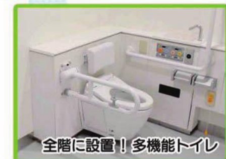
全階に設置! 多機能トイレ