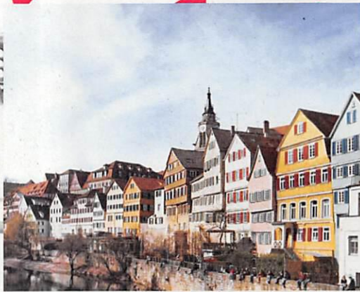
ローテンブルク市