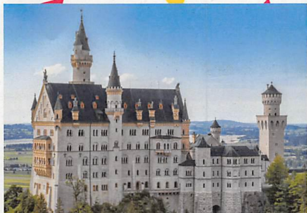
ノイシュヴァンシュタイン城