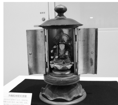
不動院弁財天坐像