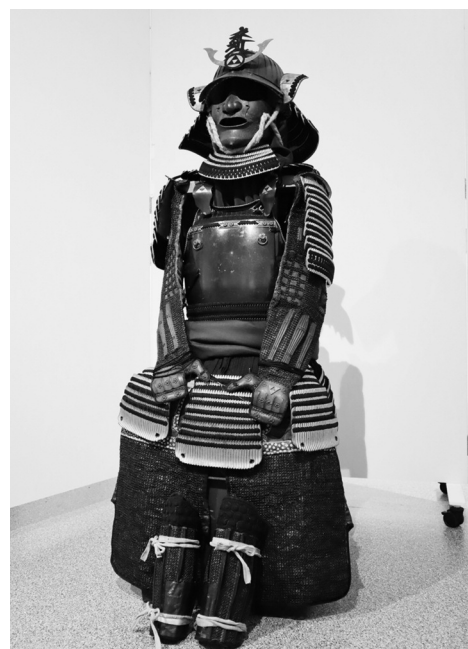
鉄鎧地三十二間筋兜 黒糸威二枚胴具足

歴史資料館が開館し、史料保存と展示公開が できるようになったことから、市の文化振興の ためにと、次のとおり寄贈がありました。