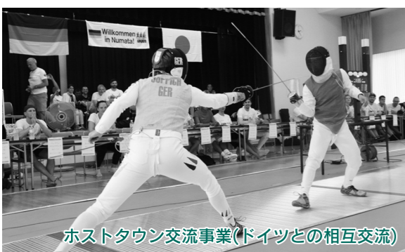
ホストタウン交流事業(ドイツとの相互交流)