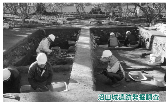
沼田城遺跡発掘調査