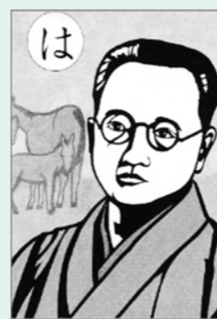
きりえ「沼田かるた」より

とき 4月28日(火)、29日(水)午前10時～午後4時 ところ 旧沼田貯蓄銀行