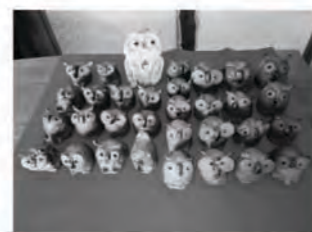
5月2日(土)~5日(火) 廣習流 人形陶芸 廣習作品展