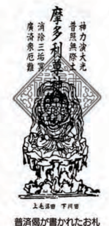
普濟偈が書かれたお札