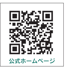
公式ホームページ

放送日時 毎週木曜日午後6時30分(10分放送) 放送周波数 76.5メガヘルツ 質問・感想を募集 番組では市長への質問や番組への感想を募集しています。次の方法で沼田エフエム放送までお寄せください ◆電話/☎1600、ファクス/☎1414、メール/danwashita@fm-oze.co.jp 過去の放送再生 過去の放送を再生できます。沼田エフエム放送公式ホームページ( http://www.fm-oze.co.jp/danwashita/ )へアクセスしてください 問い合わせ 秘書課広報聴係 ☎内線4006へ