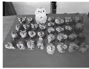
5月2日(土)~5日(火) 廣習流 人形陶芸 廣習作品展