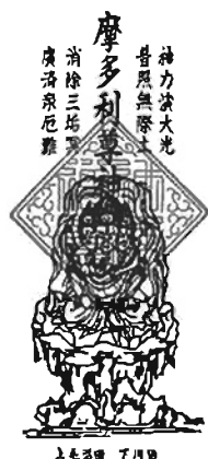
普濟偈が書かれたお札

い信仰が寄せられてきた。 祭られる本尊は像高31cmの石像物。像皮を背負う三面六臂の忿怒相で、膝の上に諸悪を打ち砕く三鈷柄の利剣を握り、他の四手は、心眼を開かせる法具、敵を倒す鉾などの武器が刻まれている。像は人畜を保護する神から、生産の神、戦闘神へと展開した、インドのシバ神の化身とされる三面六臂の大黒天である。摩多利尊神と大黒天は同体の俗説があり、ここでは厄除けの御神体として大黒天の像が安置されたのである。 今年も4月19日(日)午前11時より「マダラジン様」のご開帳と、祈願祭が執り行われる。新型コロナウイルスの感染拡大防止や終息にこの神様の偉大な力が必要だ。効果はお札を玄関先に貼ることという。