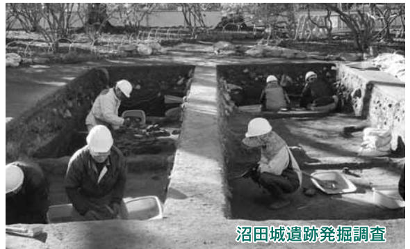
沼田城遺跡発掘調査