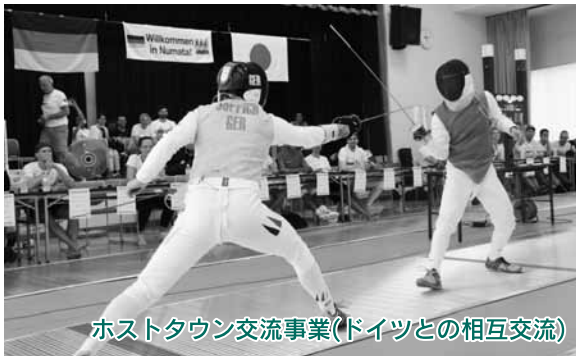
ホストタウン交流事業(ドイツとの相互交流)