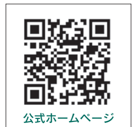
公式ホームページ

過去の放送再生 過去の放送を再生できます。沼田エフエム放送公式ホームページ( http://www.fm-oze.co.jp/danwashitu/ )へアクセスしてください