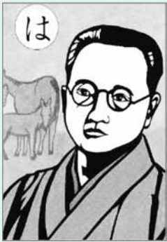
きりえ「沼田かるた」より