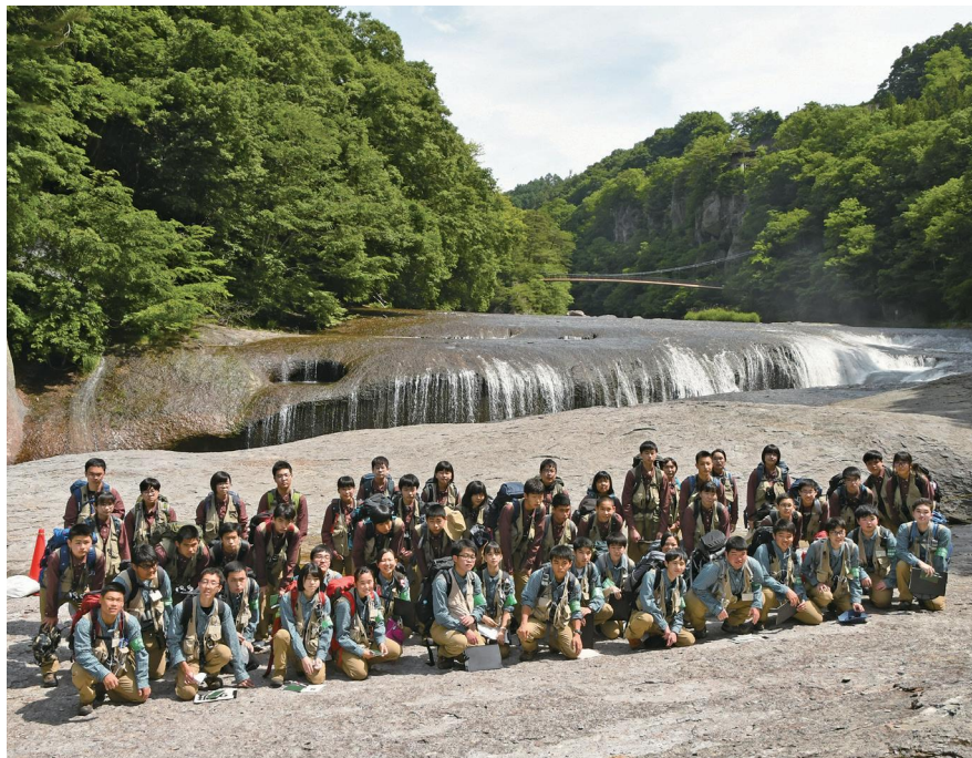
尾瀬高校 自然環境科