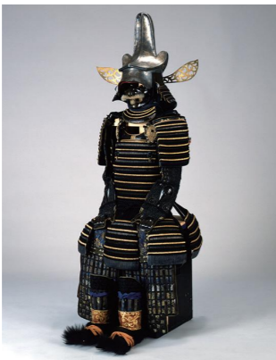
展示予定の真田信政甲冑

長野市松代町にある真田宝物館は、真田家に伝来した武具や調度品などを多数所蔵・展示しています。沼田藩初代藩主真田信幸（信之）は、沼田の地を治めた後、上田城主を経て真田氏初代松代藩主を務め、以降、松代の真田家は明治まで続きました。